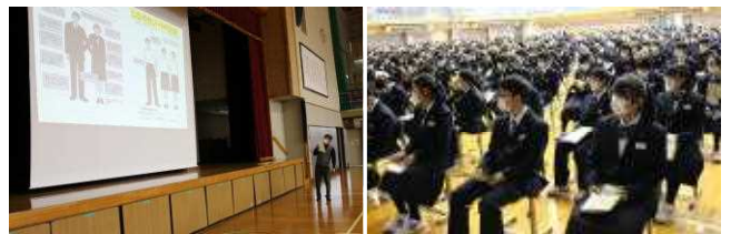
【ガイダンスの様子 いい姿勢で聞いています!】

生活面も学習面も、自分の心がけ一つで取組や成果が大きく異なってきます。安きに流れそうな自分の心を律しながら、がんばっていきましょう!