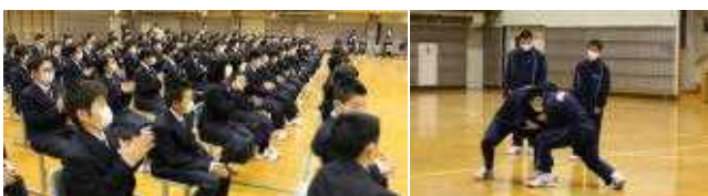
【部活動紹介の様子】

14日～21日が部活動見学期間です。できるだけ多くの部活動の様子を見ながら、自分が取り組んでみたい部活動を選んで、自分の可能性を試して行ってほしいと思っています。