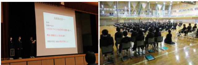
【生徒会執行部によるプレゼンの様子】

1年生の皆さんには、自分が入って活動してみたい委員会に所属し、学校生活の向上のために「気づき、考え、行動する生徒」を実践してほしいものです。また、上級生の皆さんの姿を見ながら、2年後にリーダーとなる自分を意識して、取り組んでもらえたらと思っています。