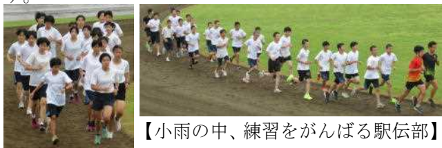
【小雨の中、練習をがんばる駅伝部】

8月11日、秋田県の「新型コロナウイルス感染警戒レベル」が5段階のレベル3からレベル4に引き上げられました。また、先週は、県内の1日の感染者数が過去最大を記録するなど、県内各地で新型コロナウイルスへの感染が拡大しています。