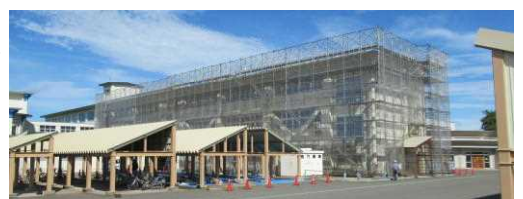
【工事用の足場で囲まれた中央棟】

夏休みに入ってから、校舎の改修工事が行われています。駐輪場の塗装工事は終わりましたが、中央棟の屋根の改修工事は10月初旬までかかる予定です。いろいろとご迷惑おかけしますが、どうか、よろしくお願い致します。