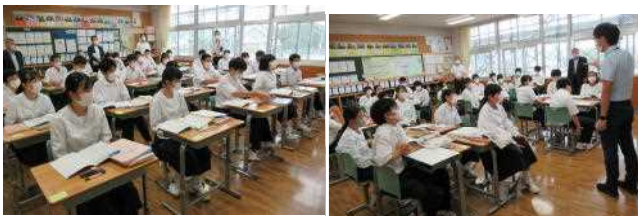
【3年5組 参観の様子 1年4組】

□学校評議員制度：開かれた学校づくりを一層推進していくため、保護者や地域住民等の意向を反映し、その協力を得るとともに、学校としての責任を果たすためのもの。