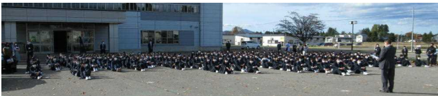
【お天気に恵まれた避難訓練となりました】

できるのであれば、各ご家庭でも、3.11の状況等をお子さんに伝えるなどしながら、命を守るための避難について会話をしていただければありがたいと思います。よろしくお願いします。