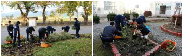
【環境委員による花壇の撤去作業の様子】

この日まで、きれいな花をたくさん咲かせ、私たちの心を和ませてくれていたお花ともお別れです。手分けして、協力しながら花の撤去と後片付けに汗を流してくれた環境委員の皆さん、ありがとうございました。よくがんばってくれました!