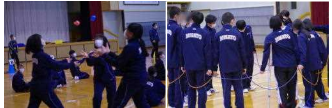
【2年生の活動の様子】