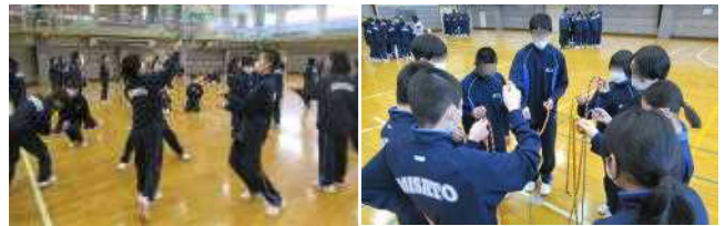
【1年生の活動の様子】

前号で紹介した「人間関係づくりプログラム」の一環として、24日(木)の5時間目に1年生、6時間目に2年生で「学級の絆づくりプロジェクト 1」を実施し、保呂羽山少年自然の家の職員3名をお招きして、PA(プロジェクトアドベンチャー)を行っていただきました。