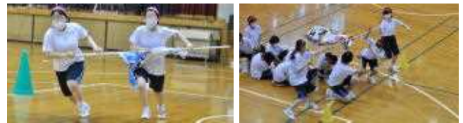
【ペア学級旗リレー タイムトライアル！】