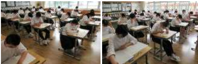
【1年生】【空気が重く感じられるテスト中】【3年生】

4月から約3か月間の勉強の成果を確認するテストです。結果としての点数にこだわるだけでなく、自分の得意・不得意、理解の程度等を確認しながら、これからの復習や夏休みの学習に生かしてほしいものです。