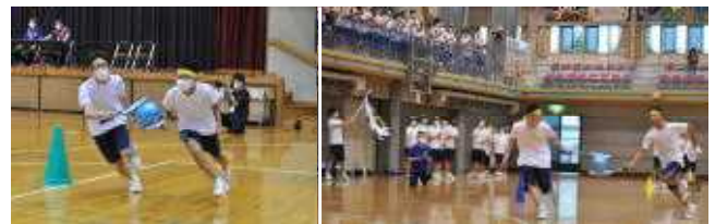
【ペアラケットリレー タイムトライアル！】