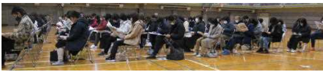
【ほぼ全員の方が参加してくれました】

中学校の生活や学習、入学式までの日程等について説明しました。中学校の校舎、新しい友達、新しい先生たちと、充実した学校生活を送ってくださることを期待しています。先輩の皆さん、よろしくお祈りします。