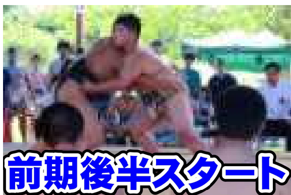
〇〇〇〇さん（東北大会個人3位・全国大会出場）

朝から生徒の元気な声に包まれ、校舎に活気が戻ってきました。34日間に渡る夏季休業期間が終了し、今日から前期後半がスタートしました。夏季休業中ではありましたが、東北大会や全国大会等での活躍、田沢湖駅伝の早朝練習を含む運動部の各種大会に向けた取組、文化部のコンクールに向けた活動、郡市英語暗唱・弁論大会のための練習など、それぞれの生徒が、自らの目標達成を目指して充実した日々を過ごしてきました。また、タイ王国への訪問交流などの貴重な体験をしてきた生徒もいます。3年生は進路選択に向けて、三者面談や各高校で行われた体験入学にも参加しています。夏季休業期間中、通常の学校生活では得られないたくさんの体験を重ねてきたことにより、子どもたち